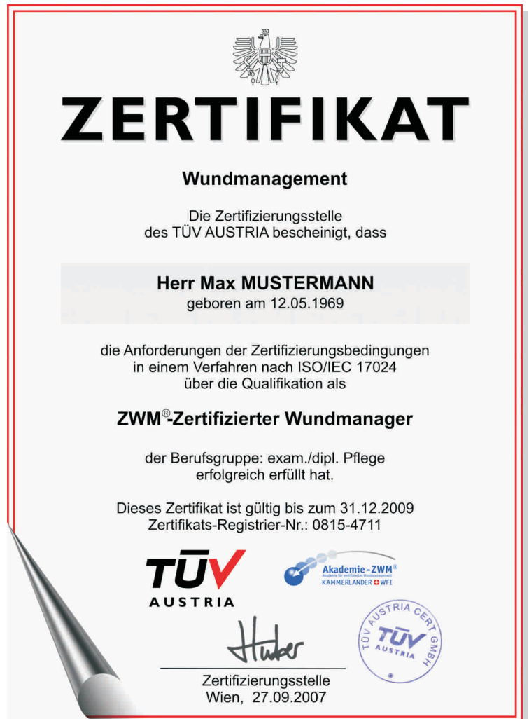
Beispielzertifikat der Fortgeschrittenenqualifikation eines exam./dipl. Pflegers

Der Name und die Qualifikationsstufe aller zertifizierten Personen werden während der Gültigkeitsdauer der Zertifizierungsnachweise zusätzlich auf den Websites des TÜV AUSTRIA und der Akademie-ZWM veröffentlicht. Eine bestehende Qualifikation ist daher für alle Interessenten jederzeit einfach abfragbar.